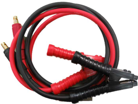
ブースターケーブル