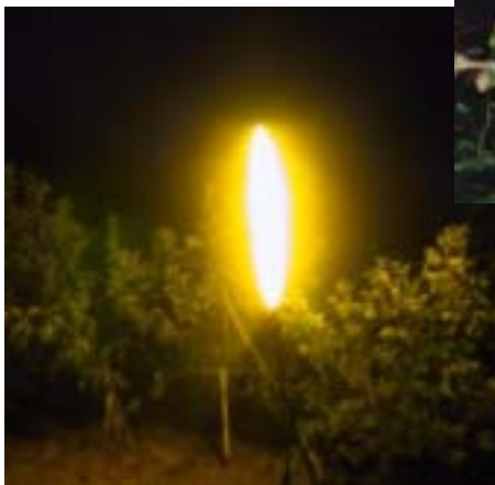
LBC - 401 桃 (屋外)