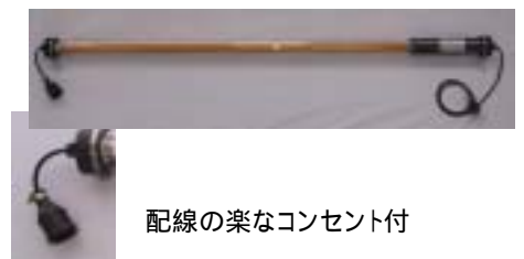
配線の楽なコンセント付