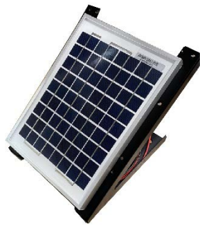
SP-250 12V 農機用 シガープラグと ワニロクリップ 1.8Mコード付