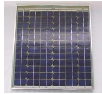
SM-700 12V 大型バッテリー用 シガープラグと ワニロクリップ 2Mコード付