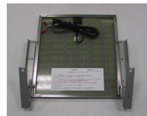
オプションのスタンド装着例