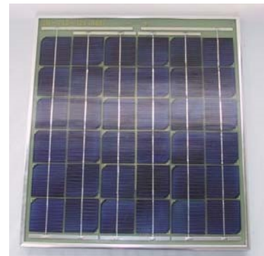
SM-440 24Vトラック、建機用 ワニロクリップ 2Mコード付