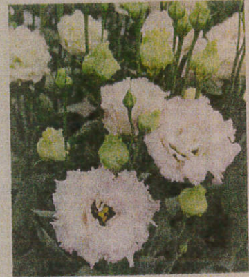
カネコ種苗の「ジュリアス イトピンク」