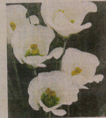
サカタのタネの無花粉トルコ ギキョウ

越してもワイド りやすい。中生 か「よりも1週 が遅い。問い合 部、(電)06(6 877。