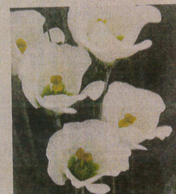
サカタのタネの無花粉トルコ ギキョウ