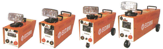
KL-8AB-20S KL-8AB-36B KL-8AB-48B KL-8AB-72B